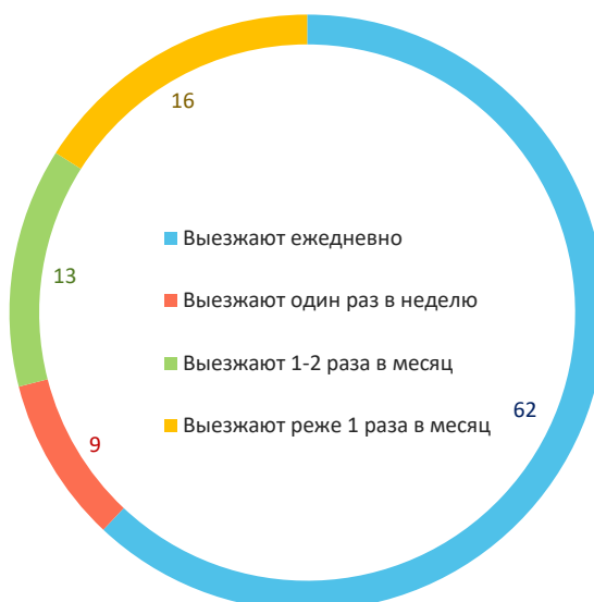
Рис. 3. Распределение занятого населения по полу в возрасте 15 лет и старше, работающего на территории другого субъекта Российской Федерации, по периодичности возвращения домой, 2013 и 2021 гг., % от общего количества мужчин и женщин