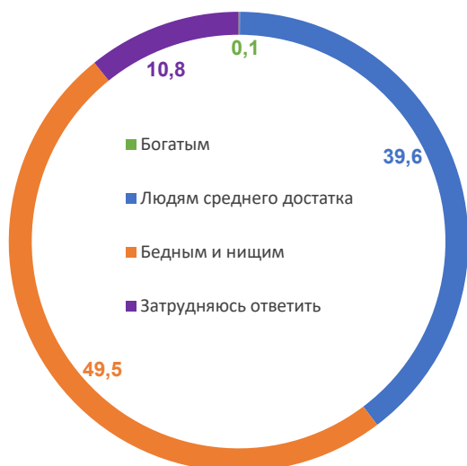
Рис. 5. Динамика социальной самоидентификации населения*, % от числа опрошенных

* Формулировка вопроса: «К какой категории Вы себя относите?».