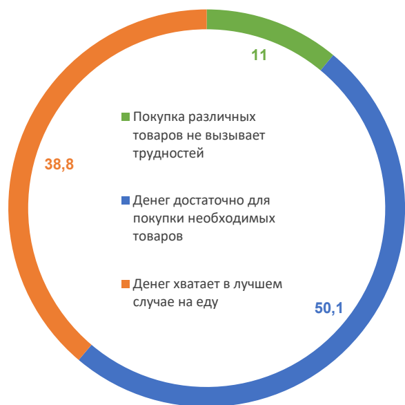
Рис. 7. Оценка покупательной способности доходов населения*, % от числа опрошенных

* Формулировка вопроса: «Какая из приведенных ниже оценок наиболее точно характеризует Ваши денежные доходы?».