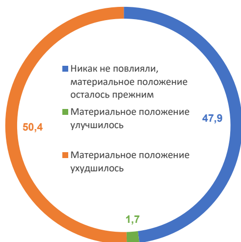
Рис. 1. Оценка влияния пандемии коронавируса на личное материальное положение*, % от числа опрошенных

* Формулировка вопроса: «Как повлияли события, связанные с пандемией коронавируса, на Ваше материальное положение (положение Вашей семьи)?».