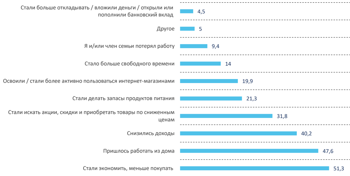
Рис. 3. Распределение ответов на вопрос «Как повлияли события, связанные с пандемией коронавируса, на Вас (Вашу семью)?»*, % от числа опрошенных

* Формулировка вопроса: «Как Вы оцениваете свое материальное положение: оно лучше или хуже, чем было год назад?».