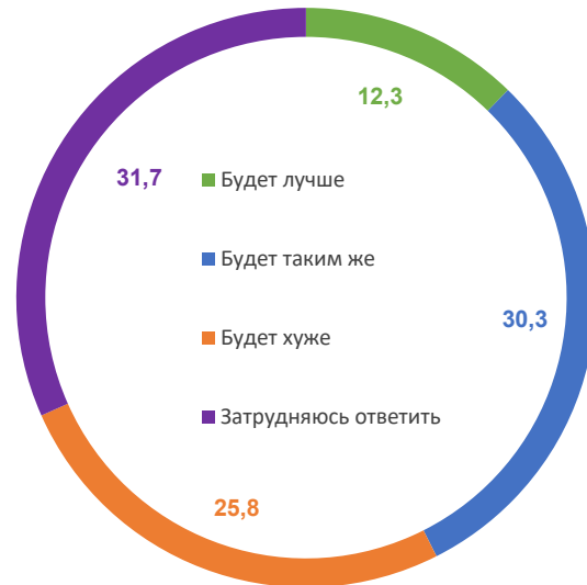
Рис. 4. Прогнозы изменения личного материального положения*, % от числа опрошенных

Текущее материальное положение людей можно оценить также с помощью показателей социальной стратификации. В частности, такой индикатор, как социальная самоидентификация, показывает, к какой из социальных категорий, слоев относит себя человек