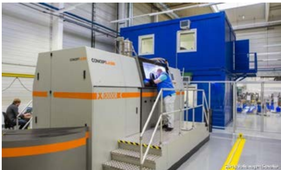
Рис. 1. Самый большой в мире 3D-принтер для массового производства металлов Xline 2000 R

В настоящее время большая часть исследований и разработок новых технологий на территории Словацкой Республики возникает скорее всего в машиностроении, которое можно назвать движущей силой экономики Словакии. Поскольку права собственности на автомобильные предприятия находятся в руках иностранных инвесторов, результаты и инновации в области НИОКР, соответственно, переданы им. В качестве примера можно привести уникальную новинку – аддитивную технологию, представленную в 2017 году компанией Volkswagen (Словакия), – крупнейший в мире серийный металлический 3D-принтер Xline 2000 R (рис. 1). Аддитивная технология может быть описана как «интеллектуальный» элемент с гибки-