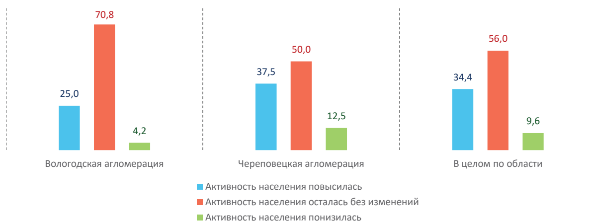
Рис. 3. Распределение ответов респондентов на вопрос «Как, по Вашему мнению, изменилась социальная активность населения за предыдущий год?», % от числа опрошенных

местного значения исходя из интересов населения с учетом исторических и иных местных традиций. Соответственно важной задачей, в том числе и органов власти различного уровня, является активизация участия различных социальных групп в управлении муниципальным образованием. Вместе с тем большинство (50–71%) опрошенных глав муниципалитетов агломерации указало на отсутствие каких-либо изменений в социальной активности населения (рис. 3).