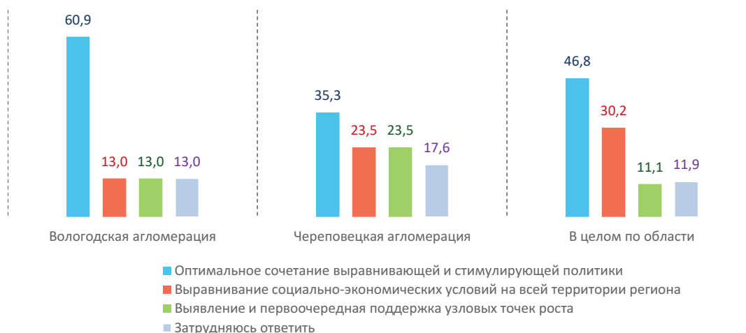
Рис. 2. Распределение ответов респондентов на вопрос «Как Вы думаете, территориальная политика в регионе должна быть направлена на ...», % от числа опрошенных